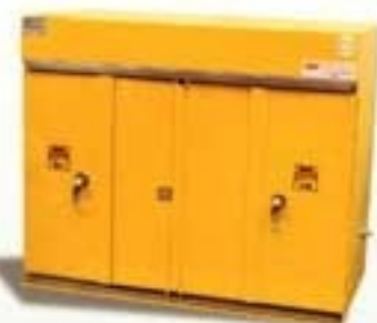
7130 ARMARIO IGNÍFUGO Líquidos inflamables // Cierre de puertas manual Cumple con norma DIN 12925. Testeado por INTI.