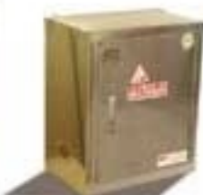
7801 ARMARIO IGNIFUGO Líquidos corrosivos/cierre de puertas manual