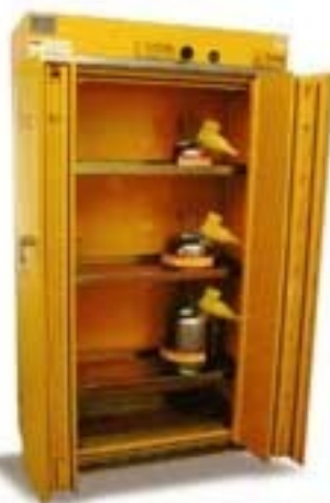
7010 ARMARIO IGNÍFUGO Líquidos inflamables // Cierre de puertas automático Cumple con norma DIN 12925. Testeado por INTI