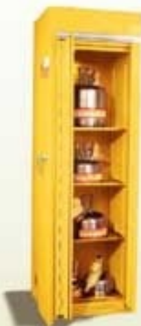
7120 ARMARIO IGNÍFUGO Líquidos inflamables // Cierre de puertas manual Cumple con norma DIN 12925. Testeado por INTI.