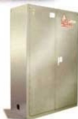
7802 ARMARIO IGNIFUGO Líquidos corrosivos/cierre de puerta manual