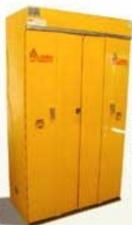
7110 ARMARIO IGNÍFUGO Líquidos inflamables / Cierre de puertas manual Cumple con norma DIN 12925. Testeado por INTI.