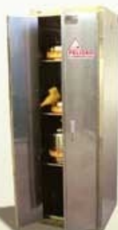
7803 ARMARIO IGNIFUGO Líquidos inflamables/cierre de puertas manual