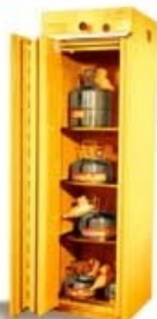
7020 ARMARIO IGNÍFUGO Líquidos inflamables // Cierre de puertas automático Cumple con norma DIN 12925. Testeado por INTI.