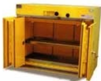
7030 ARMARIO IGNÍFUGO Líquidos inflamables // Cierre de puertas automático Cumple con norma DIN 12925. Testeado por INTI.

Utilizados para el depósito de drogas e inflamables. Totalmente contruidos en paneles rellenos de material aislante, de chapa de acero sin puntos de contacto directo. Puertas simples embutidas con solapas de cierre, bisagras continuas tipo piano. Cerradura de seguridad tipo Trabex. Disponible el cierre automático de puertas a 50°C de temperatura ambiente. Vienen equipados con ventilas automáticas de cierre por temperatura. Pintado con pintura epoxi color amarillo y bandejas electrocincadas. Posee juntas intumescentes que dilatan su volumen 25 veces a más de 100°C y sellan el armario herméticamente.