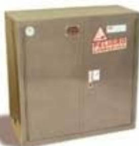
7800 ARMARIO IGNIFUGO Líquidos corrosivos / Cierre de puertas manual